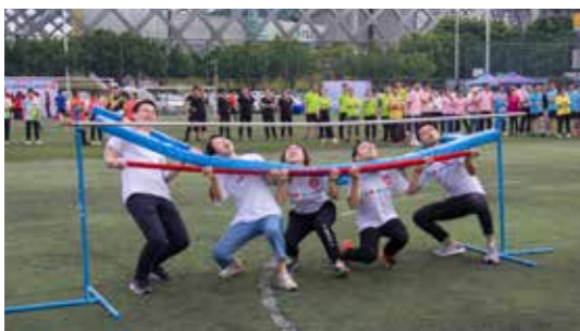
第三个项目：云梯挑战

第二个项目“同心协力”：10位队员分两组，每位队员用身体夹住瑜伽球通过障碍物，这个项目主要考验团队的协作能力，在本组比赛我们犯了急