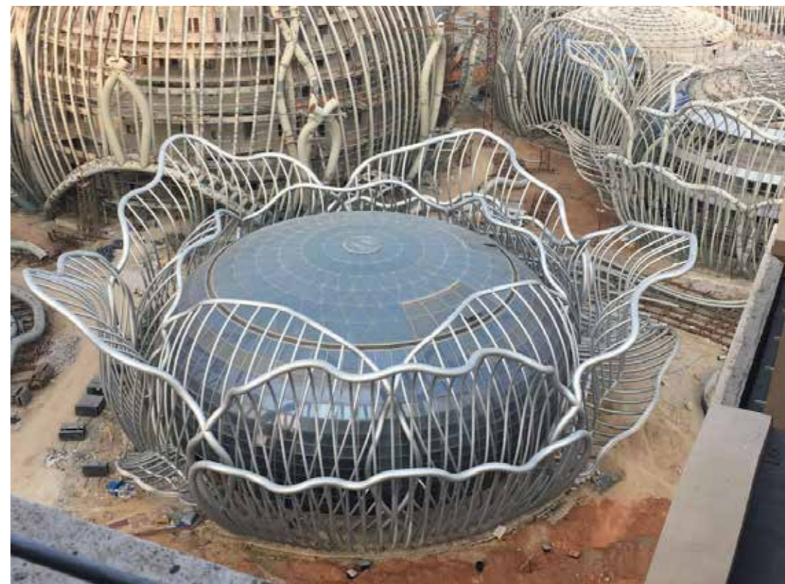
海南海花岛国际会议中心实景图

(包括260吨履带吊)通道，以及大型钢构件堆放、组装机地，加之各家施工单位同时作业，造成现场拥挤不堪，也正是由于超重型履带吊运行需要，场地内道路无法硬化(否则将被压坏)。针对现场实际状况，在项目开始实施之初，项目部积极与建设单位、各施工单位协调各家施工顺序，相互配合，与其他工种尤其花瓣钢结构施工单位形成流水作业，规定各家场地移交和使用时间，提高作业效率，盘活场地；项目部也根据现场情况编制各球体施工计划，合理组织各项材料进场时间顺序以及时间，同时，对劳务队伍每日施工任务详细安排，包括施工部位、完成数量，安装工作有条不紊推进，使得各项进场材料能尽快安装上墙形成产值。如球体主体移交后，先安装幕墙工字钢，花瓣钢构在后跟随安装，再安装幕墙铝型材，同时花瓣钢构展开钢构涂