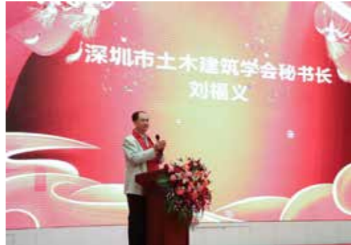
方大建科精心准备的才艺汇演