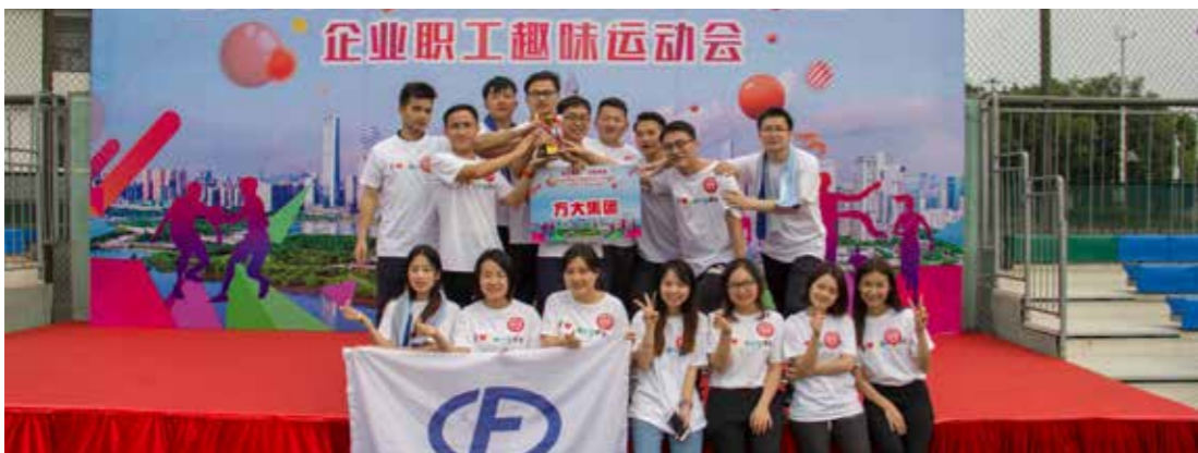
方大代表队获得第六名后合影留念