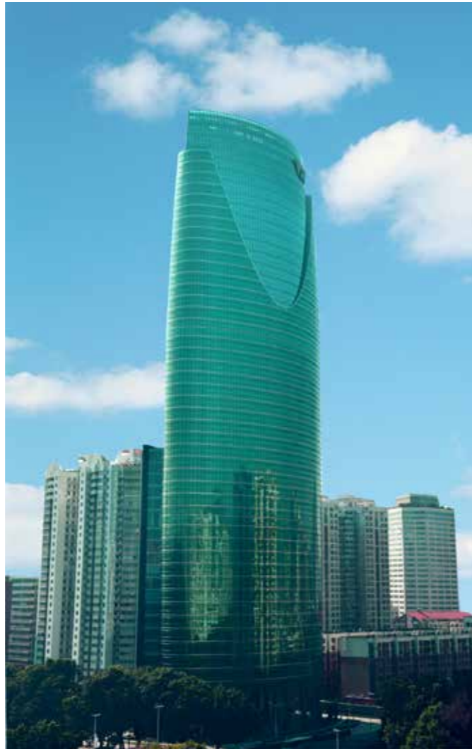
由方大建科承建幕墙工程的深圳新世纪文博中心

茁壮成长的植物在顶端冒出一株新芽。曲线型的设计不是为了将设计复杂化,而是在细节上设计出一个新的优美,温和的形体,能够在视觉上和美学上都实现永恒持久。