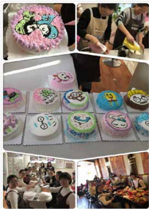
北京分公司“三八”妇女节活动照片

在北京，北京分公司为全体女员工准备了丰盛的午餐及趣味蛋糕烘焙 DIY 活动。活动中，女员工们一边听老师们的讲解，一边实际动手操作，为