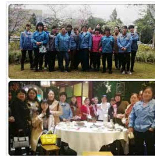
东莞公司“三八”妇女节活动照片

“三八”国际妇女节，又称国际劳动妇女节，是在每年的 3 月 8 日为庆祝妇女在经济、政治和社会等领域做出的重要贡献和取得的巨大成就而设立的节日。方大集团成立 27 年来，广大女员工伴随着公司的发展壮大历程，与男员工一道，在科技创新和企业经营管理等方面，为方大集团做出了卓越的贡献。在公司未来的发展道路中，有了广大女员工们的努力与坚守，我们一定会走得更加淡定从容。