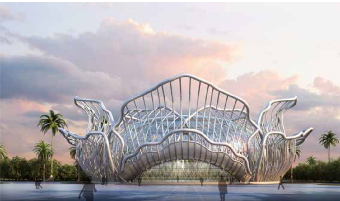
由方大建科承建幕墙的海南海花岛国际会议中心

装，待钢构涂装完毕，开展面板安装工作，各作业班组、工种协同作战，步步推进，既避免场地使用冲突，有效降低垂直交叉作业安全风险，也减少成品半成品遭受破坏和成品保护方面的支出，取得了良好的效果。通过这次与外单位进行较大规模协同施工，让我们更加明白工程前期组织策划的重要性，这必将为后续工作积累宝贵的经验。