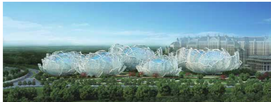
方大承建幕墙工程的海南海花岛国际会议中心

毋庸置疑，本工程乍一看就能感到巨大的施工难度，当中定有许多难题和挑战在等着我们，但回想近些年来我司承接的幕墙工程案例，没有哪一项