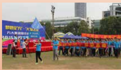
深圳分公司代表队