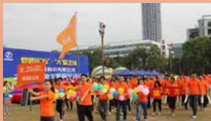
自动化公司代表队