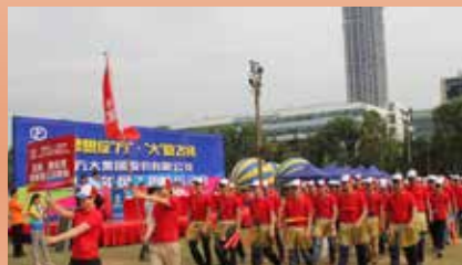
东莞、置业及新能源公司代表队