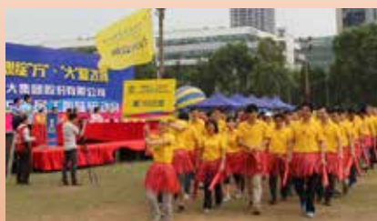
厦门分公司代表队