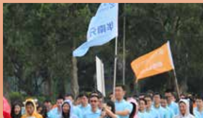
华南分公司代表队