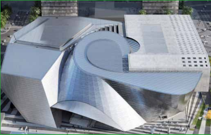
由建科集团承建幕墙工程的深圳当代艺术馆与城市规划展览馆